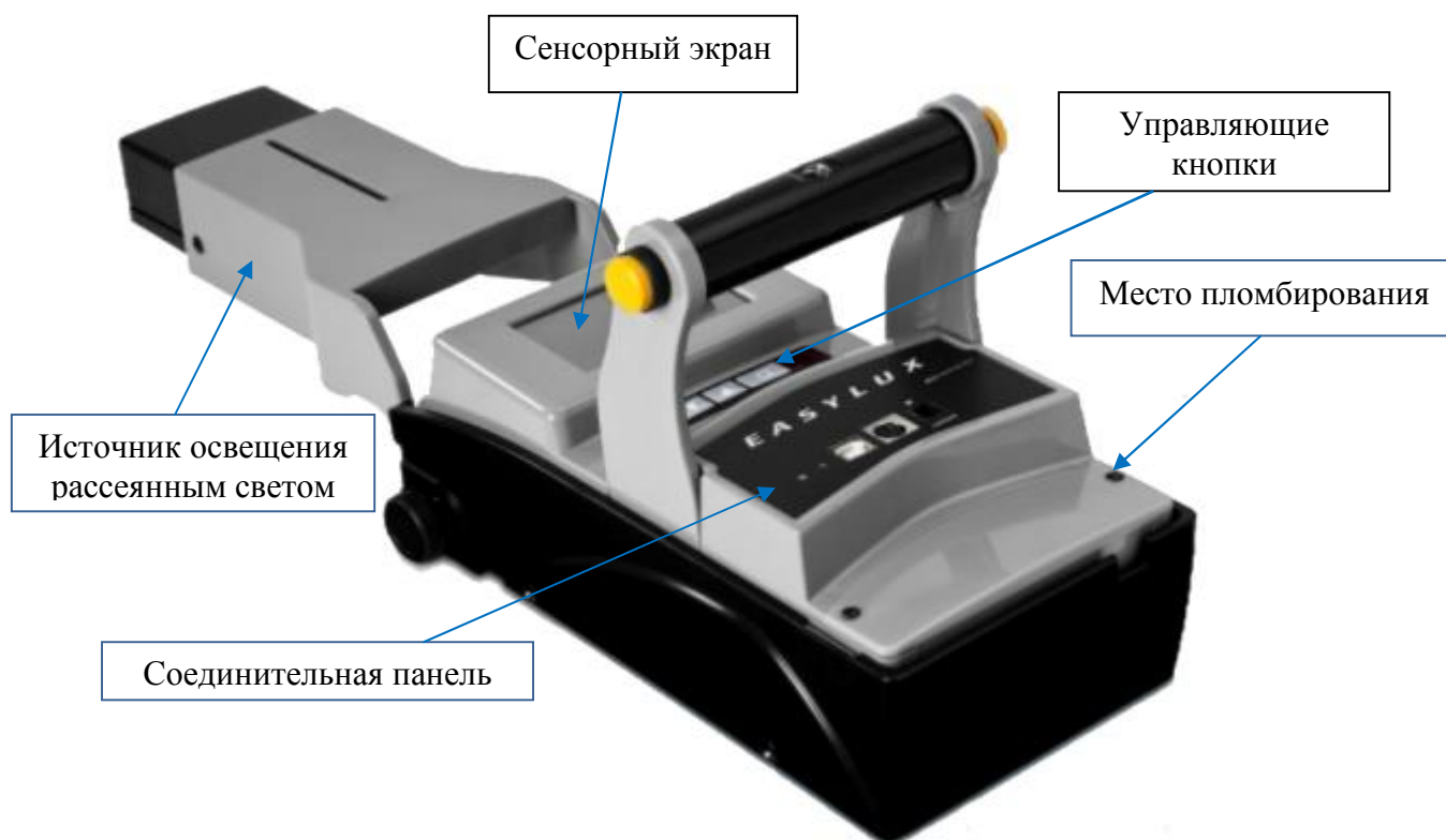
Рисунок 1 - Общий вид ретрорефлектометров MiniReflecto HORIZONTAL со схемой пломбирования

Соединительная панель ретрорефлектометров представлена на рисунке 2.